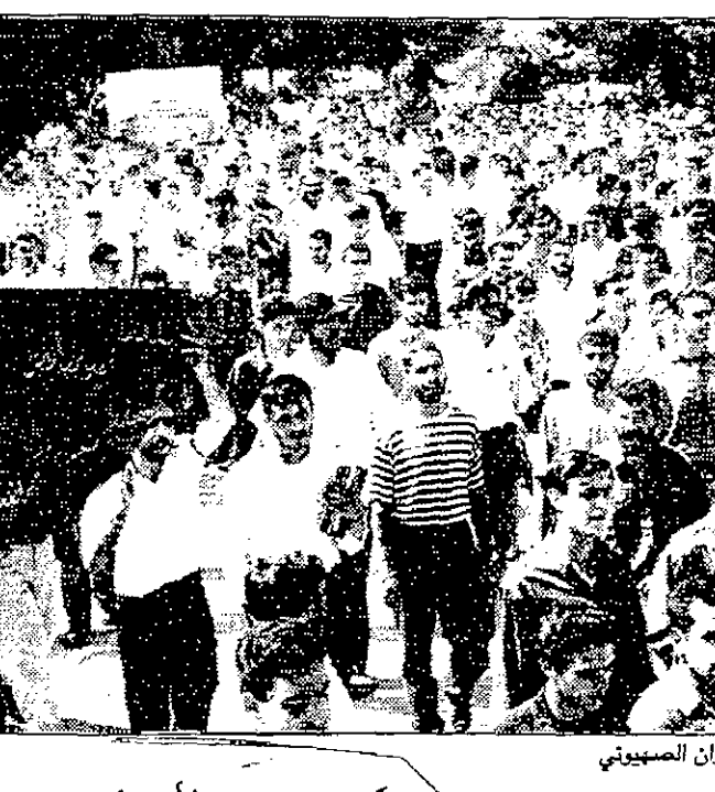
هكذا منذ الاصل

بالاضافة الى تمك اسرائيل لجمع لثلاثمائة الفاً فيما يتعلق بالاراضي الفلسطينية المحتلة ومضامنها وبرامجها الاستيطانية وقضيتها الارواح من الاسرى والعسكريين الفلسطينيين والمخاضات والاضرحة والاهلية والحيلولة بون اتصالها بحيطانها العربية، وكذلك سحب هويات المواطنين الفلسطينيين، تاركين في ماضيهم العروبي، وقد اصدر منتدى بيت القدس بياناً سوف يوزع على كافة الهيئات الفلسطينية والبعثات